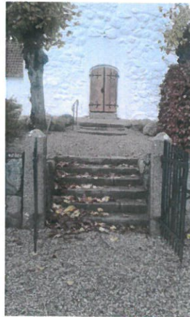
Trappe ved Gestelev Kirke som bliver renoveret