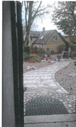
Etablering af adgangsvej ved Herringe Kirke